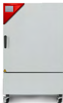
› Modelo KBF 240