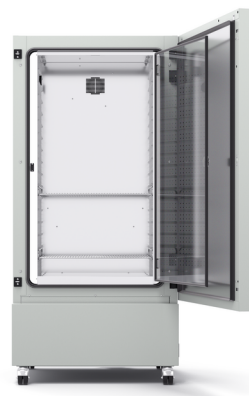
Model KB ECO 400