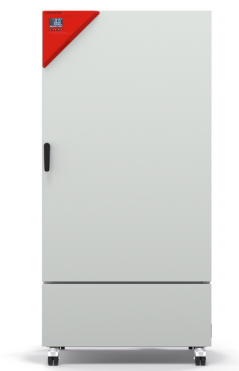
Model KB ECO 400