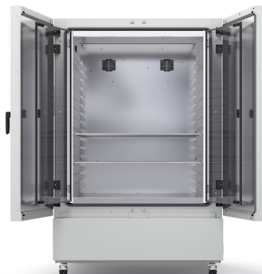
Model KB ECO 1020