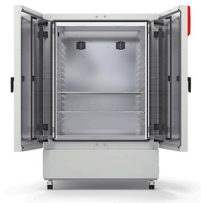
Model KB ECO 1020