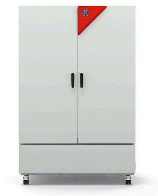
Model KB ECO 1020