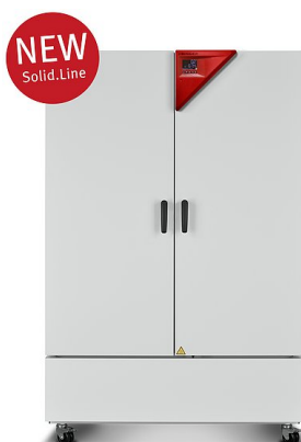
Modello KBF-S 1020