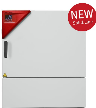
Modello KBF-S 115