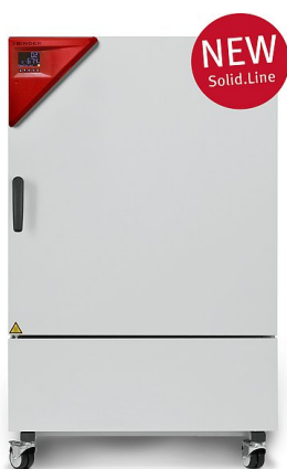
Modello KBF-S 240