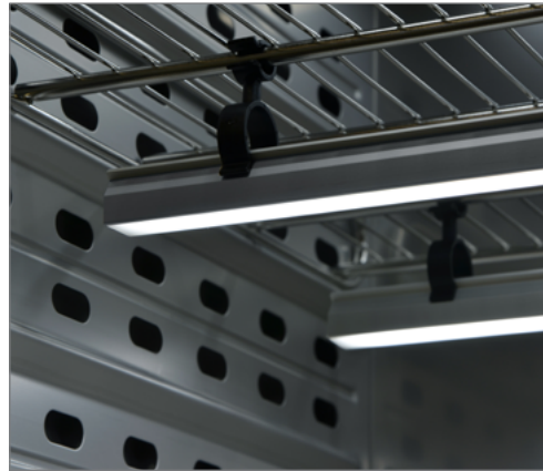
Barra luci di 50cm, fissata con clip in materiale sintetico alla griglia inseribile