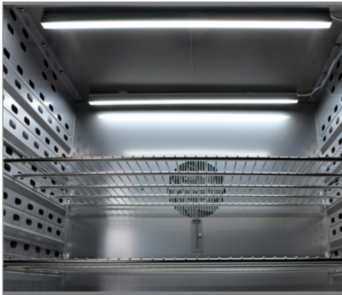
Barra luci di 50cm, fissata con Tesa Powerstrips® alla parete superiore della camera