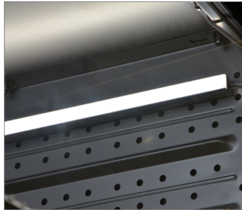
Barra luci di 30cm, fissata con Tesa Powerstrips alla parete laterale della camera