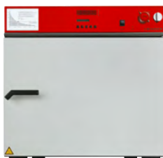
› Modelo FDL 115