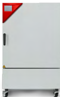
› Modèle KBF 240