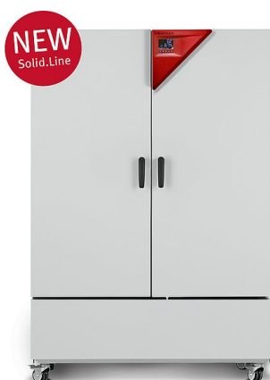
Modèle KBF-S 720