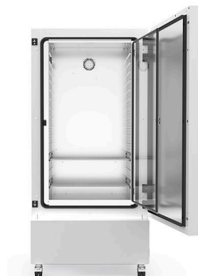
Modèle KB-ECO 400