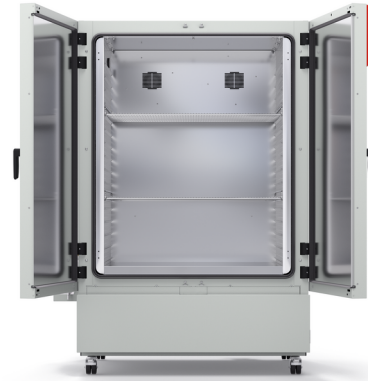
Modell KBF-S ECO 720