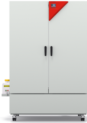
Modell KBF-S ECO 720