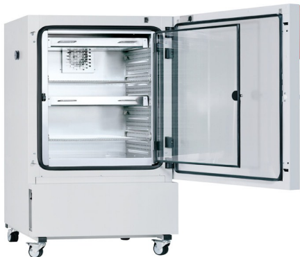
▲ Klimaschrank mit Licht KBW 720