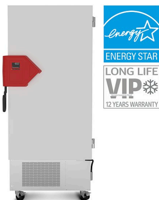
Modell UF V 500