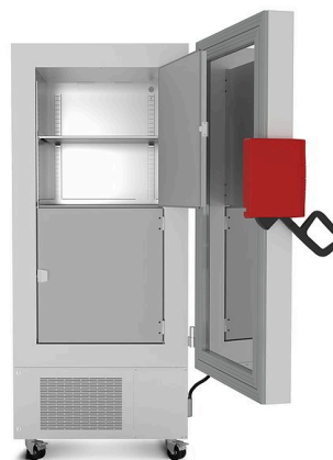
Modell UF V 500