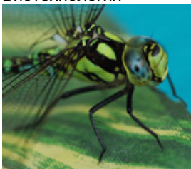
Растениеводство и разведение насекомых