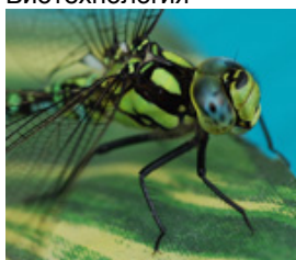
Растениеводство и разведение насекомых