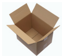
Emballage & Conditionnement