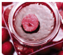
Industrie agroalimentaire / industrie des boissons