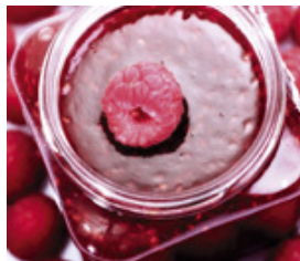
Industrie agroalimentaire / industrie des boissons