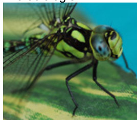
Croissance des plantes / des insectes