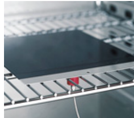
Ingénierie des surfaces