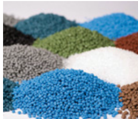
Industrie des plastiques