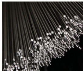
Industria del metal / construcción de maquinaria