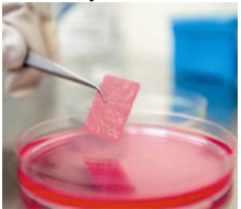
Ingeniería de tejidos biológicos