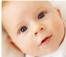
Fertilización in vitro