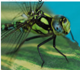
Pflanzen- / Insektenwachstum