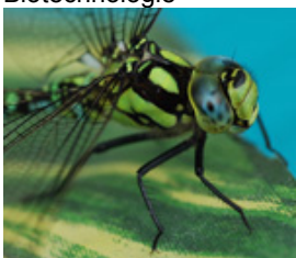
Pflanzen- / Insektenwachstum