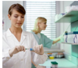
Kliniken- / Universitätskliniken